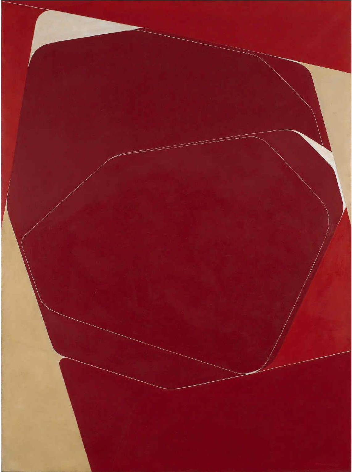
Orto V, Pablo Palazuelo (1969). Col·lecció Artium Museoa