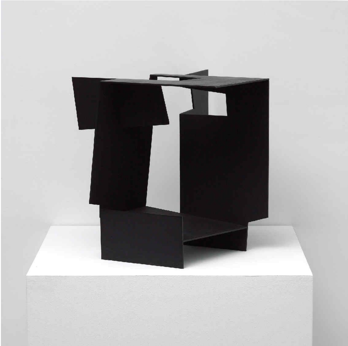
Versión previa del Homenaje a Mallarmé, Jorge Oteiza (1958). Col·lecció Artium Museoa

Pablo Palazuelo (Madrid, 1916 - Galapagar, 2007), per la seva banda, va començar estudiant arquitectura, però ben aviat es va decantar per la pintura i el dibuix. Inicialment proper al cubisme analític, la seva obra va evolucionar cap a una abstracció geomètrica carregada de significat, amb influències de Paul Klee i del constructivisme de Naum Gabo i Antoine Pevsner. Les seves composicions treballen la relació entre forma i ritme, buscant una connexió entre la geometria i una dimensió quasi espiritual. A través de la seva obra, Palazuelo va explorar la possibilitat que la geometria pogués ser un vehicle per accedir a una realitat més profunda.